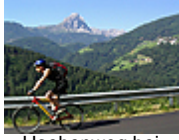
Hoehenweg bei Enneberg

Entstanden ist eine schnörkellos produzierte, professionelle Dokumentation, die sich auf die wesentlichen Aspekte der Unternehmung konzentriert. Sportliche Herausforderung des Alpencross und Darstellung der Einzigartigkeit der alpenländischen Landschaft stehen klar im Vordergrund. Fazit: Diese Produktion macht Lust auf mehr und darf in keinem DVD-Regal fehlen.